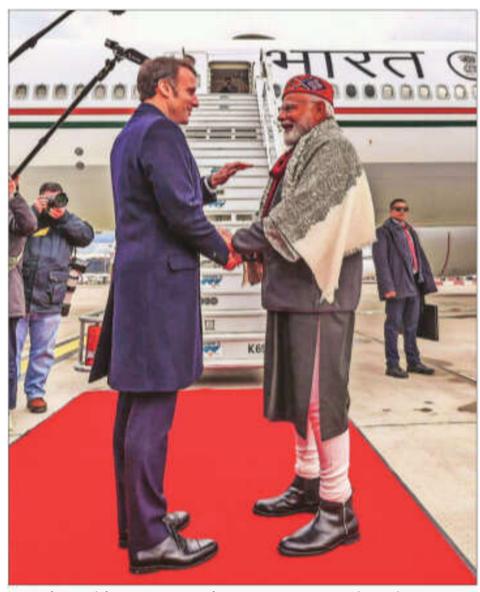
French President Emmanuel Macron accompanies Prime Minister Narendra Modi to the airport as he departs from Marseille, France, for Washington DC, USA, on Wednesday